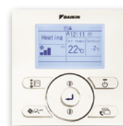
En option (BRC073)