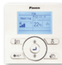
En option (BRC073)